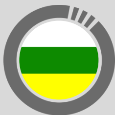
Circuito de Los Patios