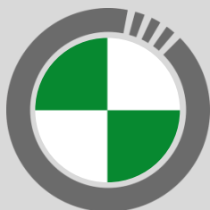
Circuito de Ocaña