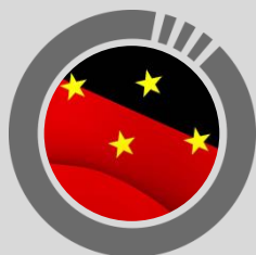
Circuito de Cúcuta